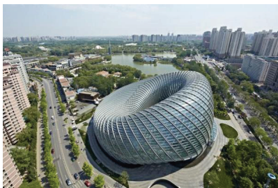
图3 北京凤凰卫视媒体中心

建筑特有的文化符号与装饰美。通过对材料的选择，对工艺的创新，与建筑形式的有机融合，使之成为现代建筑的一种特殊的视觉焦点。将传统图案元素运用到现代建筑设计中，不仅仅是一种装饰性的表达，同时也是一种文化的继承和创新。将传统图案进行抽象、几何化处理，使之保持传统美感本质，同时又能体现出简单、时尚的现代美感。以北京凤凰卫视媒体中心（图3）为例，其外墙以凤凰为灵感，运用现代科技手段对传统纹样进行了现代解读。建筑的立面造型设计，不但提高了建筑物的可辨识度，而且在光影的变换中，也能表现出不同的文化意境。将传统图案元素进行现代运用，不仅继承了传统文化，而且在现代建筑设计中进行了创造性的创造，赋予了建筑丰富的文化内涵与视觉吸引力。