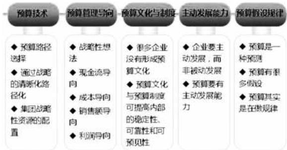
图2: 全面预算体系的构建示意图

环节开展管理,而是贯穿在水利工程建设的过程中,需要在各个阶段和各个环节当中予以有效的落实 [6] 。但是,结合现阶段水利工程管理的实际情况来看,部分水利建设单位在开展预算管理工作时,只是把目光放在项目前期工作的预算阶段,而在实际执行的过程中,却并没有做好监督工作。而这一问题的存在,很大一部分原因是由于预算监督机制的缺乏,为了保证预算管理工作的效率,就应当从建立完善的预算监督机制入手,这样才能够在最大程度上发挥出预算管理的作用。全面预算体系的构建示意图见图2。