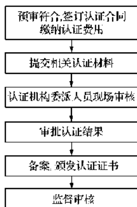
图2 测量管理体系认证流程