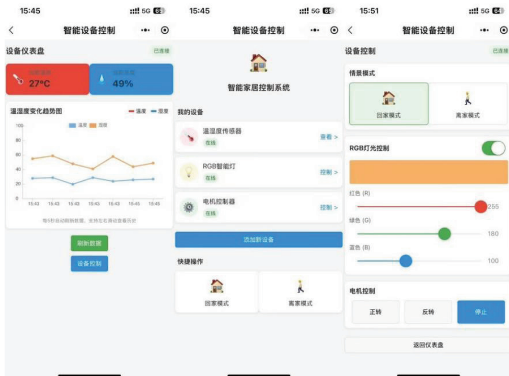
图2 小程序设备控制面板

●实时数据看板：使用微信小程序的图表组件绘制温湿度折线图，每5秒从本地拉取数据并刷新视图，支持横轴时间戳标记与数据点缩放。当温度超过预设阈值或检测到障碍物时，触发弹窗提醒并推送系统通知，及时告知用户异常情况。