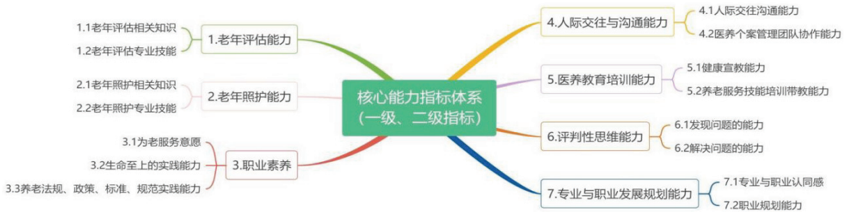
图1 核心能力指标体系一、二级指标