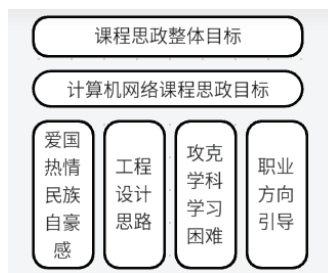
图2 计算机网络课程思政目标分解