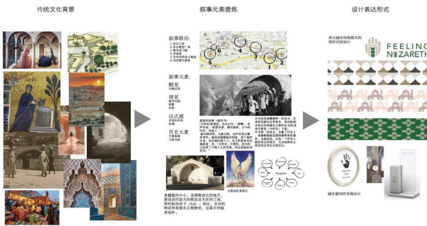
图2 学生的设计案例1