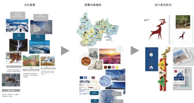
图3 学生的设计案例2

梅花鹿是市民最喜爱的一种动物, 梅花鹿在这里既是野生动物又是家畜。在延吉市被集约化驯养, 又同时被当作野生动物进行保护, 寓意美好。作为美的象征, 梅花鹿也有获得好运的寓意, 身体纤巧腿细长, 形象美观, 性格温和。我的设计是利用梅花鹿的形象作为一种独特的视觉设计语言, 它叙述着城市和居民之间特殊的情感关联。