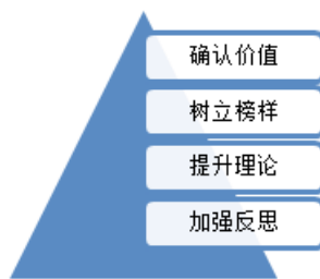
图 1: 教师自我转变四步骤

教师在处理师生矛盾时，应该充分尊重、认识和理解学生，同时也要在这个过程中接纳自己的情感和反应。理解学生的个性特点、背景和心理发展阶段是建立良好师生关系的关键。教师需要意识到每个学生都是独一无二的个体，有着不同的需求、挑战和成长轨迹。