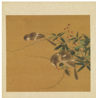
五代十国 黄筌 《长春花鸟册》（其一）

黄筌注重构图的和谐与生动，其作品饱满而充满活力，彰显出一种雍容华贵的气质，如《长春花鸟册》中收录的大部分作品。从他的作品中，我们可以看出他对绘画的严谨态度，画面工整细致，非常注重构图的完整性与和谐性 [8] 。