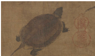
五代十国 黄筌 《写生珍禽图》（局部）