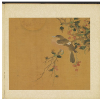
五代十国 黄筌 《长春花鸟册》（其二）