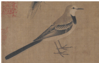
五代十国 黄筌 《写生珍禽图》（局部）

在题材的选择上，黄筌追求名贵的富有象征寓意的珍禽、花木，很少选用普通的花草，偶尔有简单常见的花草，黄筌会将这些花草表现得优雅清丽但不突兀。宋人郭若虚认为画家的志趣和生活环境决定了他的作品题材，黄筌长期生活在富贵的环境之中，搜集的题材大部分是一些高贵富丽的事物，他画的较多的是御花园中的珍禽瑞鸟、纯白雉兔、奇花怪石、孔雀之类的珍品，常表现出这些奇花怪石、珍禽瑞鸟的生动姿态，体现宫廷的审美情趣 [6] 。