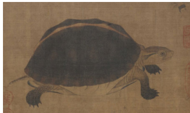
五代十国 黄筌 《写生珍禽图》（局部）