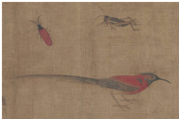
五代十国 黄筌 《写生珍禽图》（局部）