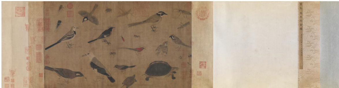
五代十国 黄筌 《写生珍禽图》

他画的大多是以动物为主,所以在着色时特别注意了颜色与形状之间的关系和变化。通常情况下,使用纤细的笔勾勒出轮廓后,再使用笔进行上色。在上色