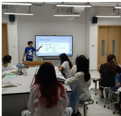
图 1 翻转课堂联合 PBL 教学法应用于诊断学实验课理论授课部分, 图为学生讲述移动性浊音的查体方法。

首先, 翻转课堂联合 PBL 教学法在实验课理论课的应用。诊断学体格检查教学包括一般检查及头颈部查体、胸部查体、心脏查体、腹部查体及神经系统查体五大部分, 在每个部分实验课前一周布置任务, 学生结合理论大课堂的授课内容, 以 2~4 人为一组, 围绕“该部分查体的视触叩听内容是什么”进行查体内容及查体手法的理论课复习、制作 PPT。实验课堂上, 先由“小老师”讲解、其他学生提问、老师点评及梳理、小结本节课内容要点。(图 1)